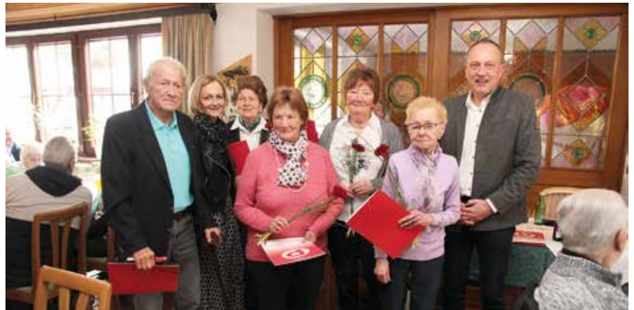
Ehrungen unserer treuen Mitglieder

Ein perfekter Begleiter für Ausflüge und Reisen, der Rucksack vom PVÖ. Das Vereinsjahr schließen wir mit der