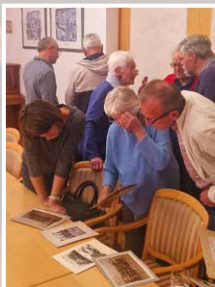
Gemeinsames Sichten und Dokumentieren – die „St. Gallener Zeitreise“ nimmt Fahrt auf.