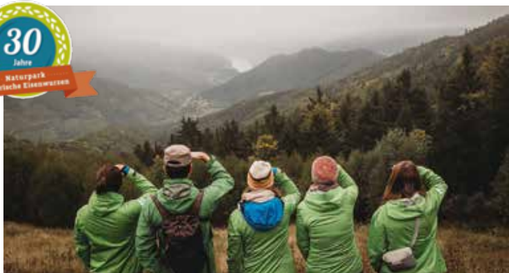
Das Naturparkteam blickt gespannt auf das Jubiläumsjahr und die nächsten 30 Jahre