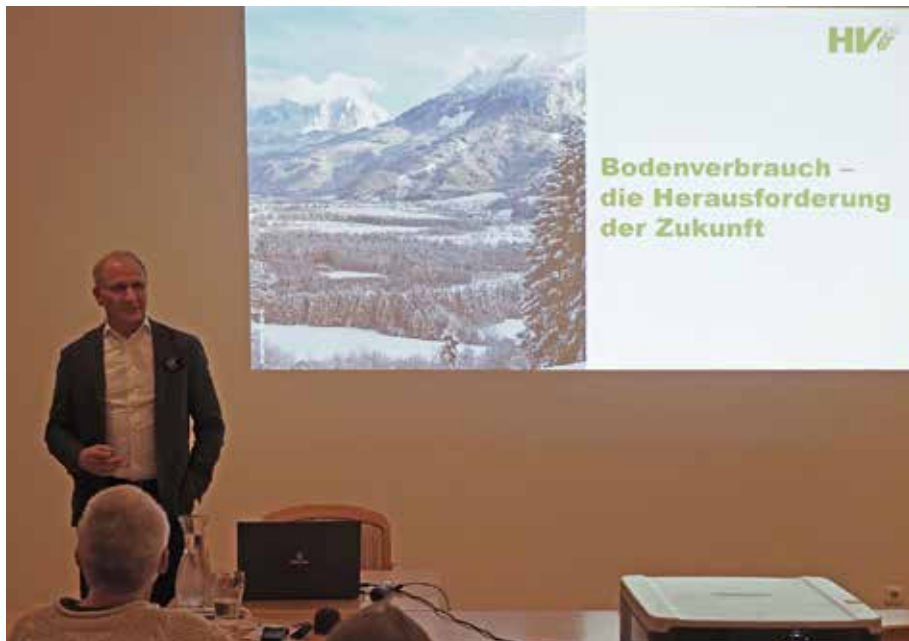
Vortrag im GH Hensle